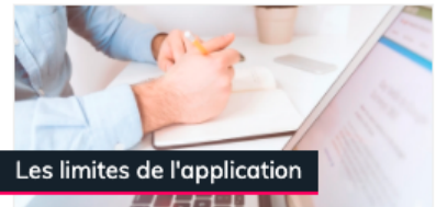
Les limites de l'application