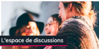
L'espace de discussions