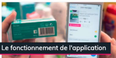
Le fonctionnement de l'application